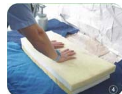
適當地加壓使粘效果達到最佳