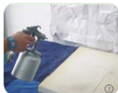
均勻噴塗, 以雲狀或顆粒狀效果為佳