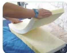
合理時間的碰置是良好粘性的保證